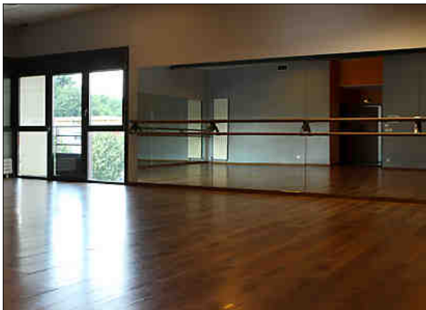
Studio de danse d'Alban Minville

Mercredi : 18h00-19h00 Enfant Mercredi : 19h00-20h00 Adultes Jeudi : 18h30-19h30 Samba Adultes ??? Samedi : 13h00-14h00 Enfants