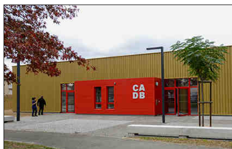
Centre d'animation de Bordeblanche