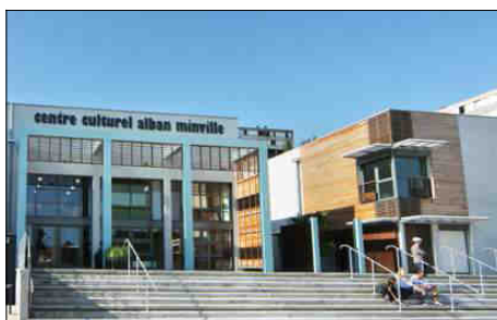
Centre Culturel Alban Minville