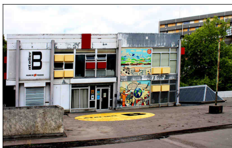
Centre d'animation de la Reynerie