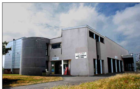
Centre d'animation de Saint-Simon

Les centres culturels et les centres d'animations du Territoire 5 de la Mairie de Toulouse ainsi que les associations hébergées vous proposent un éventail d'activités créatives, physiques et sportives dont vous trouverez le détail dans les pages ci-après.