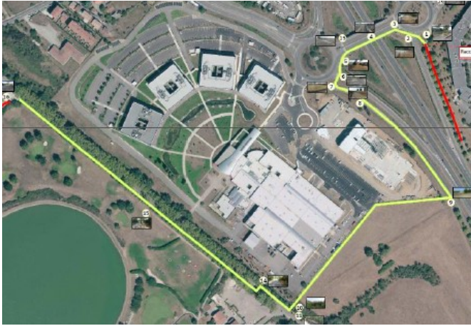
Création d'une piste cyclable vers Storage-Tek/La Raméee