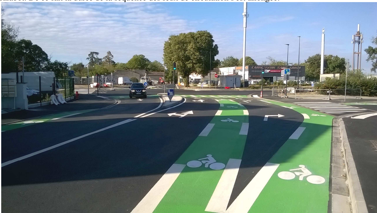
Vue du carrefour côté rue Paulin Talabot

Avec un peu de retard, le carrefour complet a été mis en service vers mi-septembre. Comme expliqué dans notre numéro précédent, il permet maintenant toutes les combinaisons de passage entre les voies de Basso Cambo, Bd Eisenhower, rue Paulin Talabot. De ce fait la durée de la séquence des feux de circulation s'est allongée.